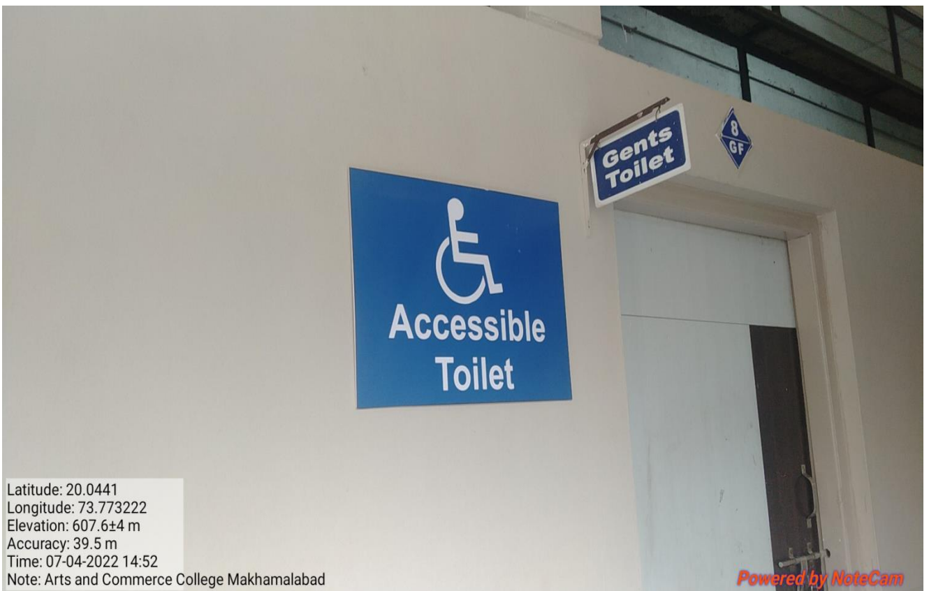
Disabled-friendly washrooms for Gents