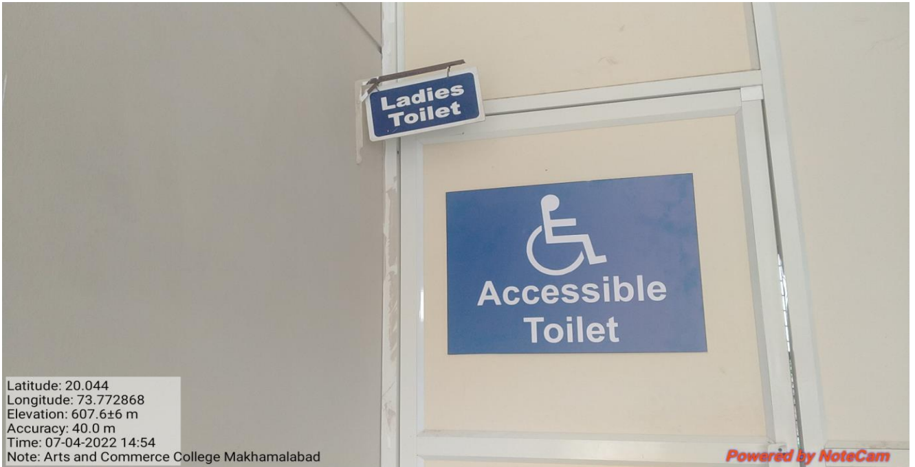
Disabled-friendly washrooms for Ladies