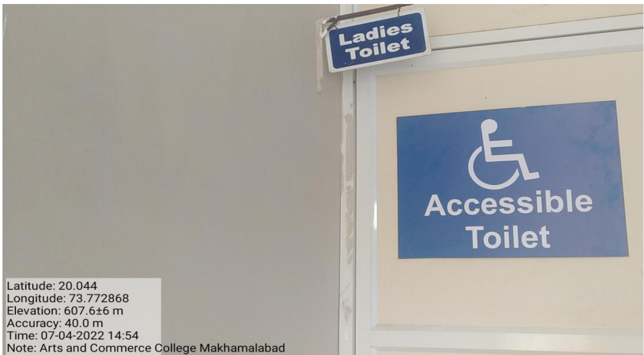
Signage Disabled-friendly washrooms