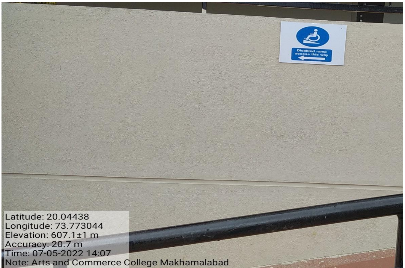
Signage Wheelchair Access Ramp