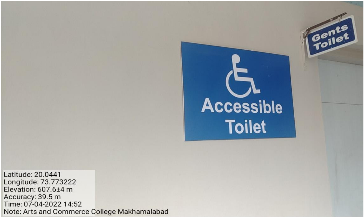
Signage Disabled-friendly washrooms