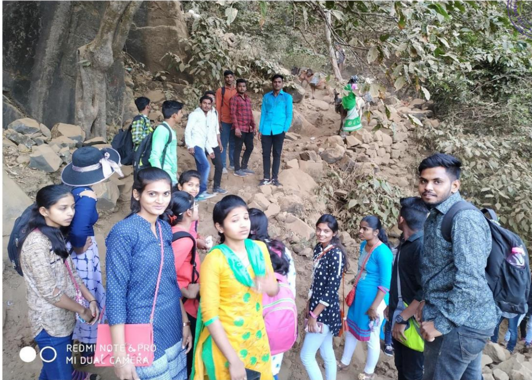
Student were Participated in the Educational Study Tour on 07/02/2019