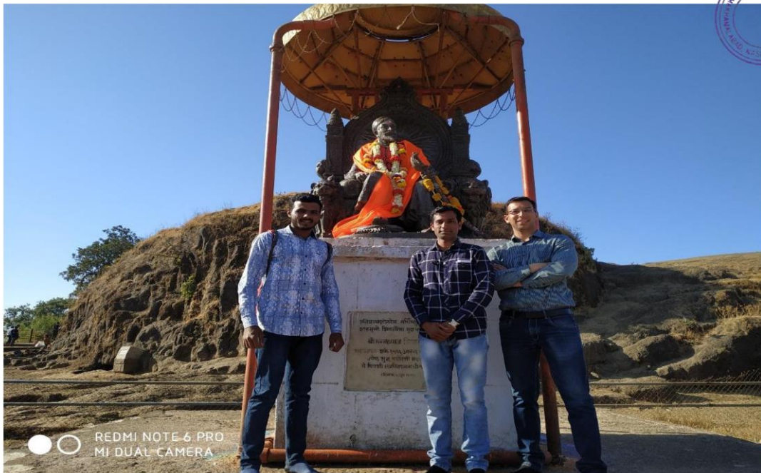
Student were Participated in Educational Study Tour on 07/02/2019

Patil Principal Arts, and Commerce College, Makhmalabad, Nashik